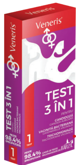
TEST 3 ÎN 1 PENTRU CANDIDOZĂ VAGINITĂ BACTERIANĂ TRICHOMONIAZĂ