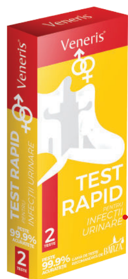
TEST RAPID PENTRU INFECȚII URINARE