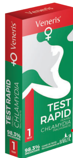
TEST RAPID PENTRU CHLAMYDIA TRACHOMATIS

PASUL 1 Testează-te pentru infecție urinară și folosește testul de pH pentru infecție vaginală