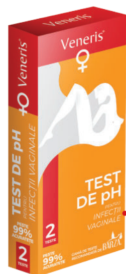
TEST DE pH PENTRU INFECȚII VAGINALE